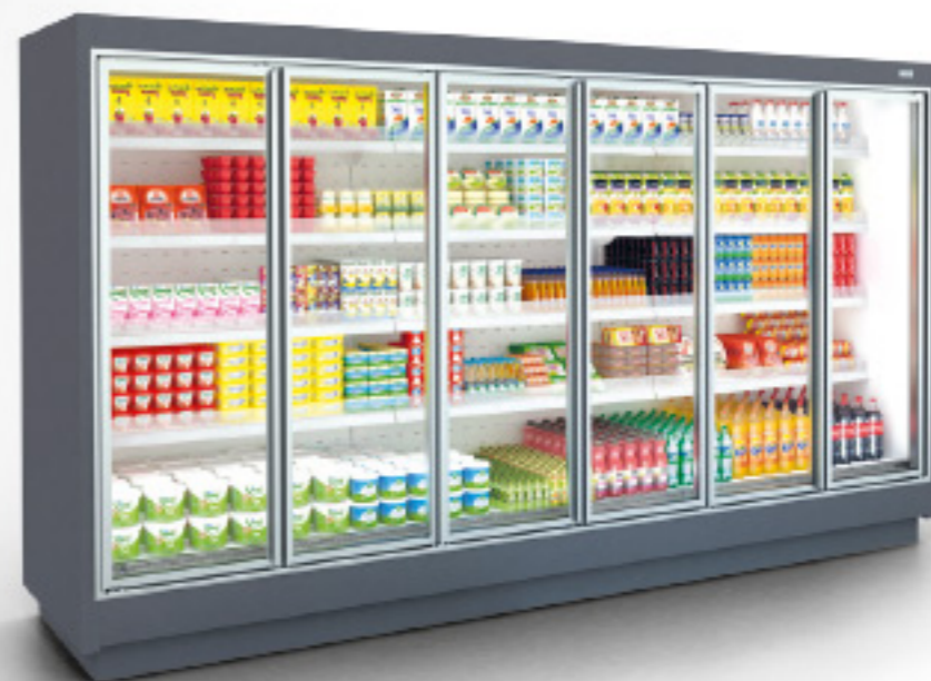
Menteşeli Kapı/Hinged Doors