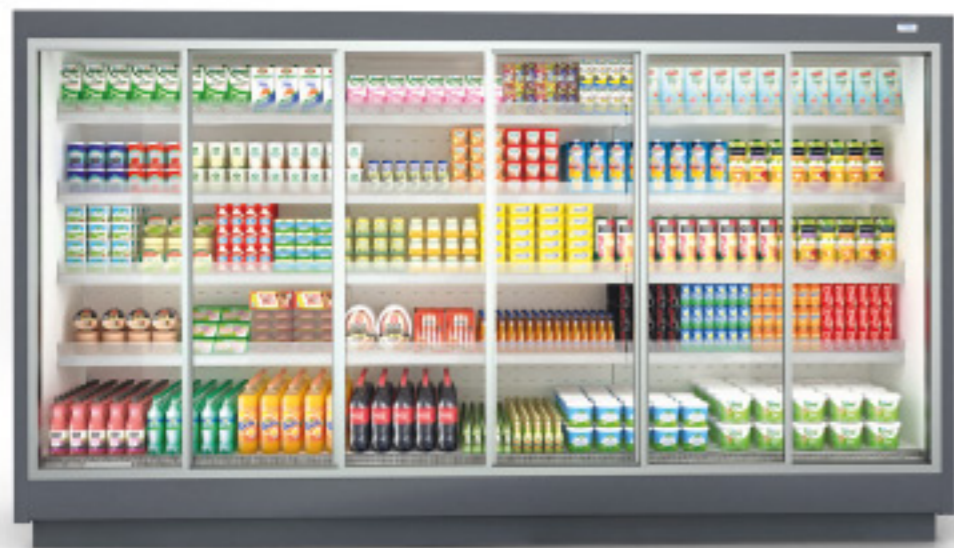
Sürgülü Kapı/Siding Door